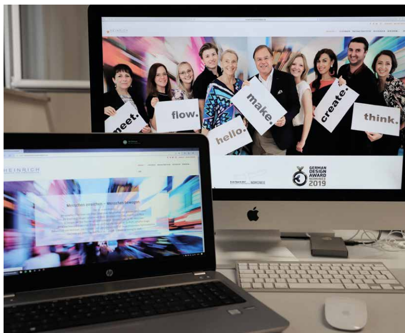
Modern, kreativ und optimiert – Eindrücke von unserer neuen HEINRICH-Website!